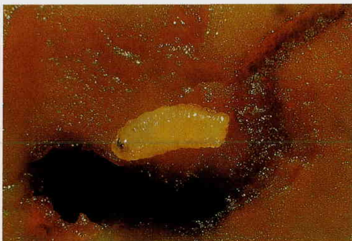
Larva ápoda, coloración blanca.

Los adultos son buenos voladores, se alimentan de sustancias azucaradas e incluso de las gotitas que exudan los frutos de la aceituna. Ponen normalmente un único huevo por fruto.