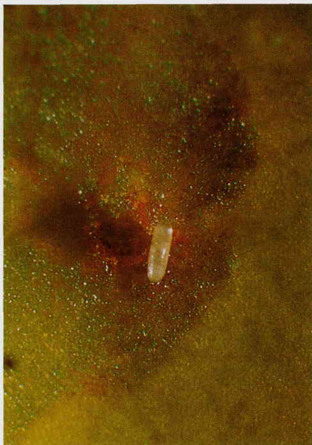
Huevos de color blanco lechoso.

El adulto mide 4-5 mm de longitud, teniendo una envergadura de 10-12 mm. Coloración general del cuerpo pardo rojizo con manchas oscuras. Ojos grandes con reflejos verde azulados, Tórax negruzco rojizo en la parte superior, con tres líneas longitudinales, escudete color blanco marfil. Alas alargadas, transparentes con una pequeña mancha oscura en el extremo. Balancines amarillo claro, casi blanco. Patas amarillentas, con los tarsos y el ápice de las tibias más oscuros. Abdomen color pardo rojizo con manchas laterales negras y 5 segmentos visibles. La hembra con ovipositor. Pupa elíptica, alargada, de 4-5 mm de longitud por la mitad de anchura. Coloración pardo rojizo. Larva ápoda acéfala, coloración blanca y forma cilíndrica cónica. Mide 6-8 mm de longitud por 1,3-1,4 mm de anchura máxima. Pasa por tres estadios larvarios.