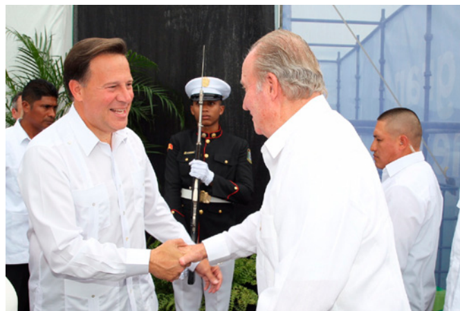
Su Majestad el Rey Don Juan Carlos recibe el saludo del entonces presidente de la República de Panamá, Juan Carlos Varela, a su llegada a las esclusas de Cocolí.-Panamá, 26.06.2016.