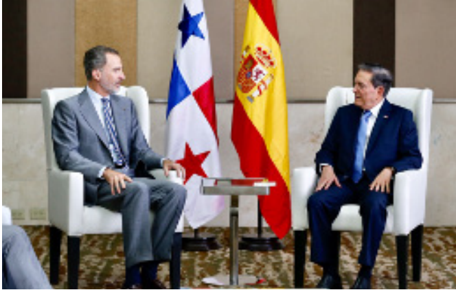
Encuentro entre Don Felipe y Su Excelencia Laurentino Cortizo, presidente electo de la República de Panamá, con motivo del viaje de SM para asistir a la Conmemoración del V Centenario de la Ciudad de Panamá.-30/06/2019.