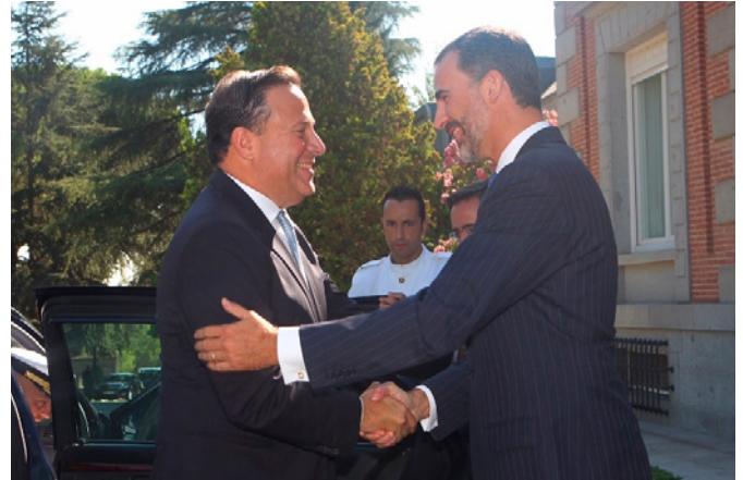
SM el Rey recibe al presidente recibe de Panamá, Juan Carlos Varela, a su llegada al Palacio de La Zarzuela.- Madrid, 08.09.2014