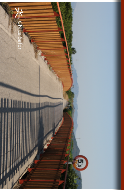
CN La Safor