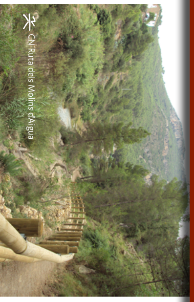
CN Ruta dels Molins d'Aigua

Este Camino Natural discurre por el término municipal de la localidad castellanense de Lucena del Cid, conocida como la «Perla de la Montaña». Sus 11 km de longitud transcurren a lo largo del río también llamado Lucena, donde el visitante puede descubrir varios molinos antiguos que aprovechaban la fuerza motriz de sus aguas y las plácidas badinas donde aquellas se remansan, en plena montaña media de la comarca de l'Alcalatén.