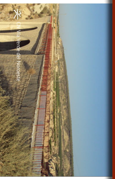
CN Vía Verde del Noroeste