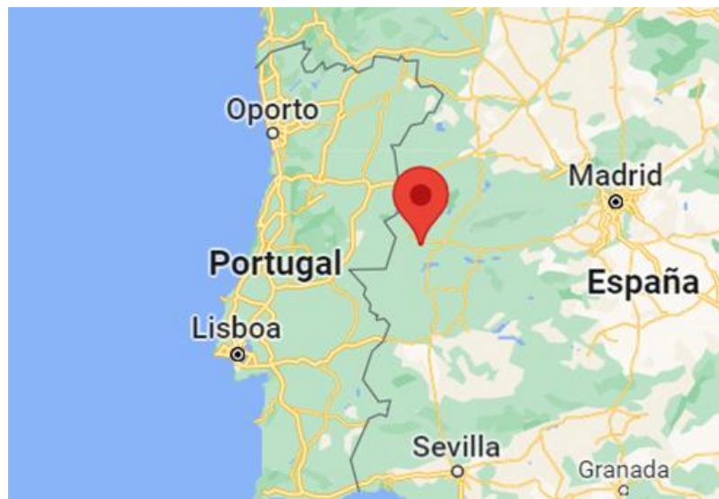
Mapa 1: localización del foco S4

Los Servicios Veterinarios Oficiales de la Junta de Extremadura han notificado la primera detección del serotipo 4 del virus de la Lengua azul en la presente temporada de actividad vectorial 2022-2023, en bovinos centinela presentes en una explotación ubicada en el municipio de Coria, en la provincia de Cáceres. Ver mapa 1.