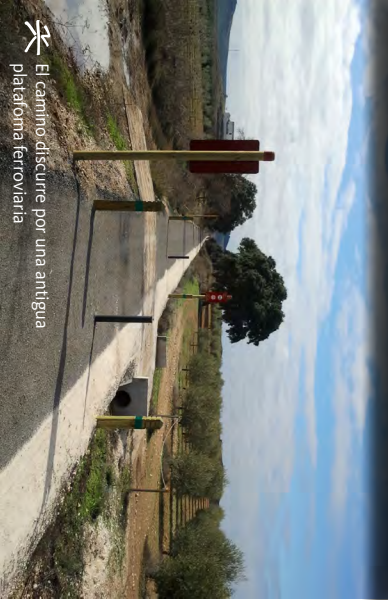
El camino discurre por una antigua plataforma ferroviaria.