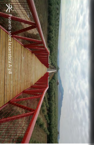
Pasarela sobre la carretera A-318.