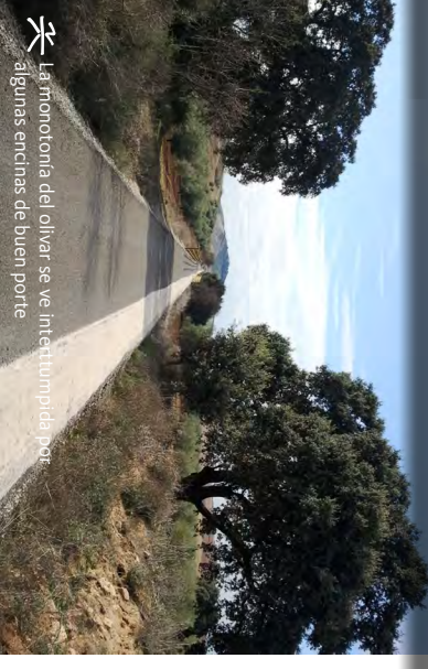
La monitoría del olivar se ve interrumpida por algunas encinas de buen porte.