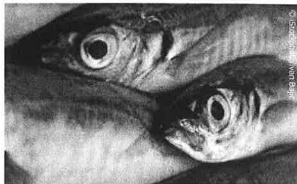
L'UE encourage les pratiques de pêche durables.

Les États membres bénéficient également d'autres mesures financières pour leurs activités statistiques et pour la surveillance et l'exécution de la politique commune. En ce qui concerne la politique étrangère de la pêche, les accords de