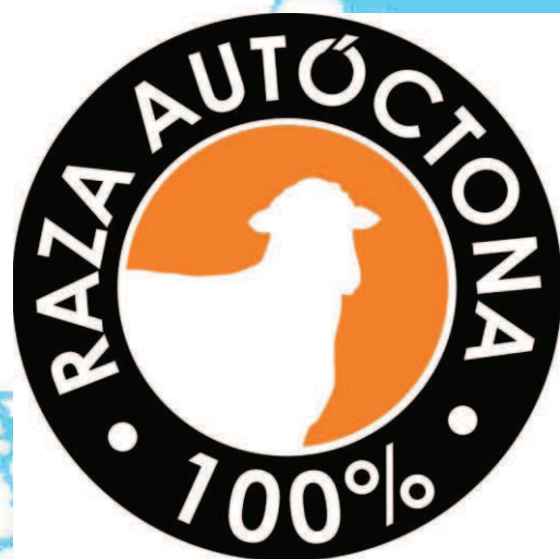
Imagen corporativa de la “RAZA AUTÓCTONA 100% ANSOTANA”