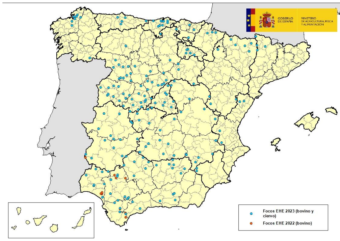
Mapa 1: Focos de EHE en España en años 2022 y 2023

Desde la última actualización sobre la enfermedad realizada el pasado 11 de octubre, el Laboratorio Central de Veterinaria (LCV) de Algete, laboratorio nacional de referencia para esta enfermedad, ha confirmado casos de enfermedad hemorrágica epizootica (EHE) en 9 nuevas comarcas, todos en explotaciones de bovino en las comarcas de: Ordes (La Coruña); Reinosa (Cantabria); Llanes y Pravia (Asturias); Sabiñánigo (Huesca); Ocaña (Toledo); Benavente (Zamora); Arganda del Rey y Navalcarnero (Madrid). Ver mapa 1.