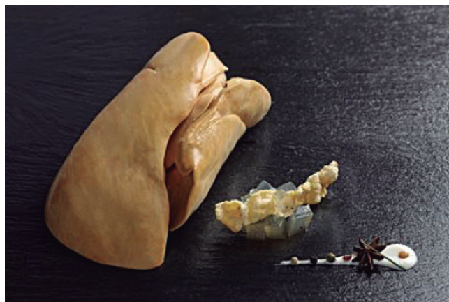
Trabajamos por un producto mítico, cargado de historia y simbología. EL FOIE GRAS.

INTERPALM (Organización Interprofesional de las Palmípedas Grasas), consciente de los retos actuales, en especial los que tienen que ver con la bioseguridad en las explotaciones ganaderas, ha elaborado este Manual con la intención de que sirva de ayuda a los profesionales del sector en la actividad diaria de las explotaciones de palmípedas destinadas a la producción de foie gras.