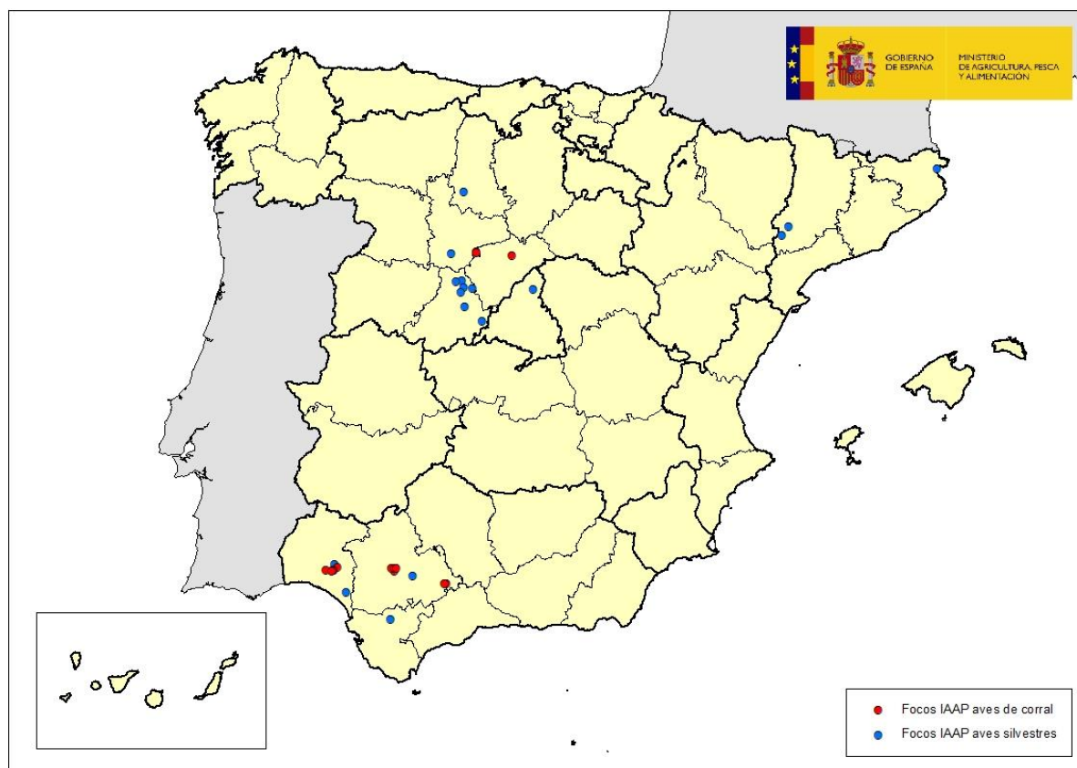
Mapa 2: localización los focos totales de IAAP detectados en 2022