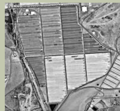
Fotografías: diferentes casuísticas en parcelas aseguradas; una parcela catastral con dos cultivos distintos, una parcela catastral en la que se cultivan dos variedades de viña, y una parcela catastral con invernaderos