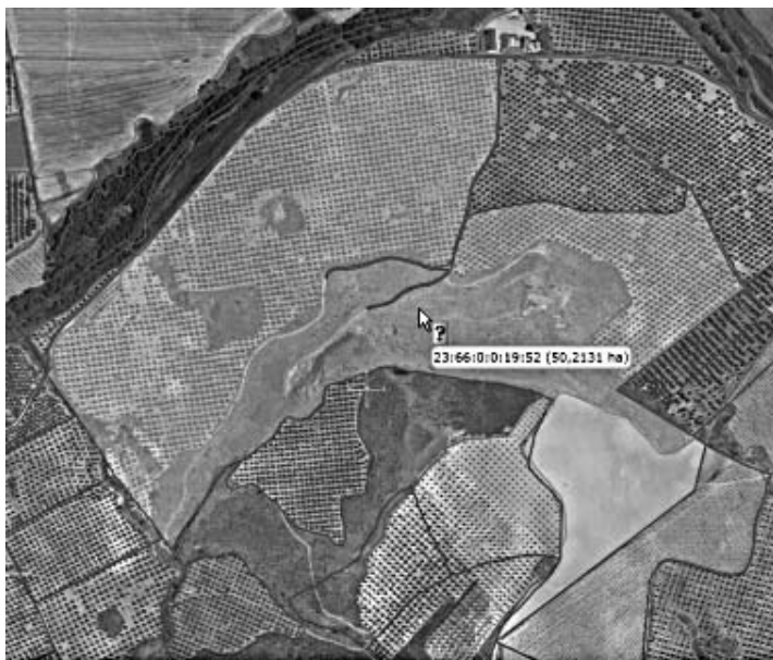
Fotografía: parcela SIGPAC que contiene diferentes recintos.

La identificación de parcelas del SIGPAC ha permitido introducir una nueva definición de parcela aplicada en los seguros agrarios del Plan 2011.