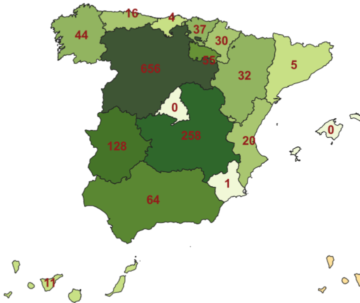
Altas por CC.AA.