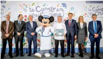
Presentación del proyecto en Madrid.

“Gracias a este proyecto estamos apoyando los valores de la alimentación saludable”