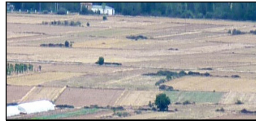
Paisaje de Destriana

De este modo, se puede considerar que la calidad del paisaje en Destriana ha disminuido a partir del proceso de concentración parcelaria. Actualmente, se produce un contraste entre la unidad paisajística del monte, con zonas elevadas y pobladas de densa vegetación, y la unidad paisajística de la zona de vega, donde prevalecen extensas formas lineales y homogéneas de las parcelas concentradas de esta unidad. La cubierta vegetal de la vega tiende a ser continua con poca variedad y rugosidad, los colores presentan escaso contraste y aparecen tonalidades apagadas y uniformes. El fondo escénico, es decir, el paisaje circundante correspondiente a la unidad del monte, potencia positivamente la calidad visual paisajística.