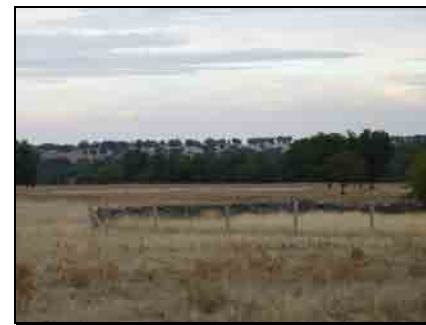
Paisaje de Escudro

En lo que se refiere a la cuenca visual , es decir, el nivel de visibilidad o número de puntos que pueden divisarse desde cada unidad del paisaje, destaca el caso de Destriana ya que ésta es muy alta frente a los otros municipios de estudio, gracias al relieve pronunciado de la parte norte del municipio correspondiente a la unidad de monte, así como en la unidad de vega, cuya extensión propia de esta unidad, hace que, desde ambas unidades, se puedan observar una serie de amplias panorámicas. Además, es posible observar elementos visualmente atractivos, como son las masas arbóreas del monte y la línea de vegetación de ribera.