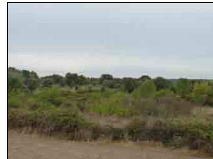
Paisaje de Brincones

Por el contrario, en Brincones, al no experimentar procesos de concentración parcelaria, se percibe una alta calidad del paisaje. Existe una mayor naturalidad, que se traduce en un mayor grado de variedad de especies vegetales y en densas masas boscosas. Además, las combinaciones de color y texturas son intensas y variadas, por la conservación de los muros, por la vegetación natural y la rotación en el uso del suelo agrícola. También se perciben contrastes agradables de color entre suelo, vegetación, roca y agua.