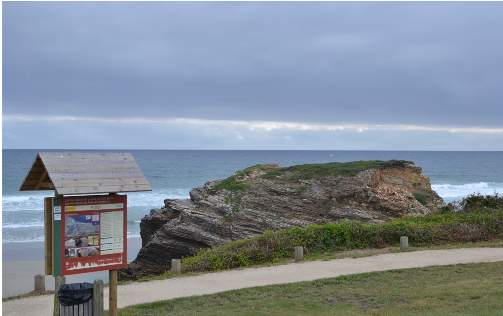
Playa Las Catedrales, Lugo