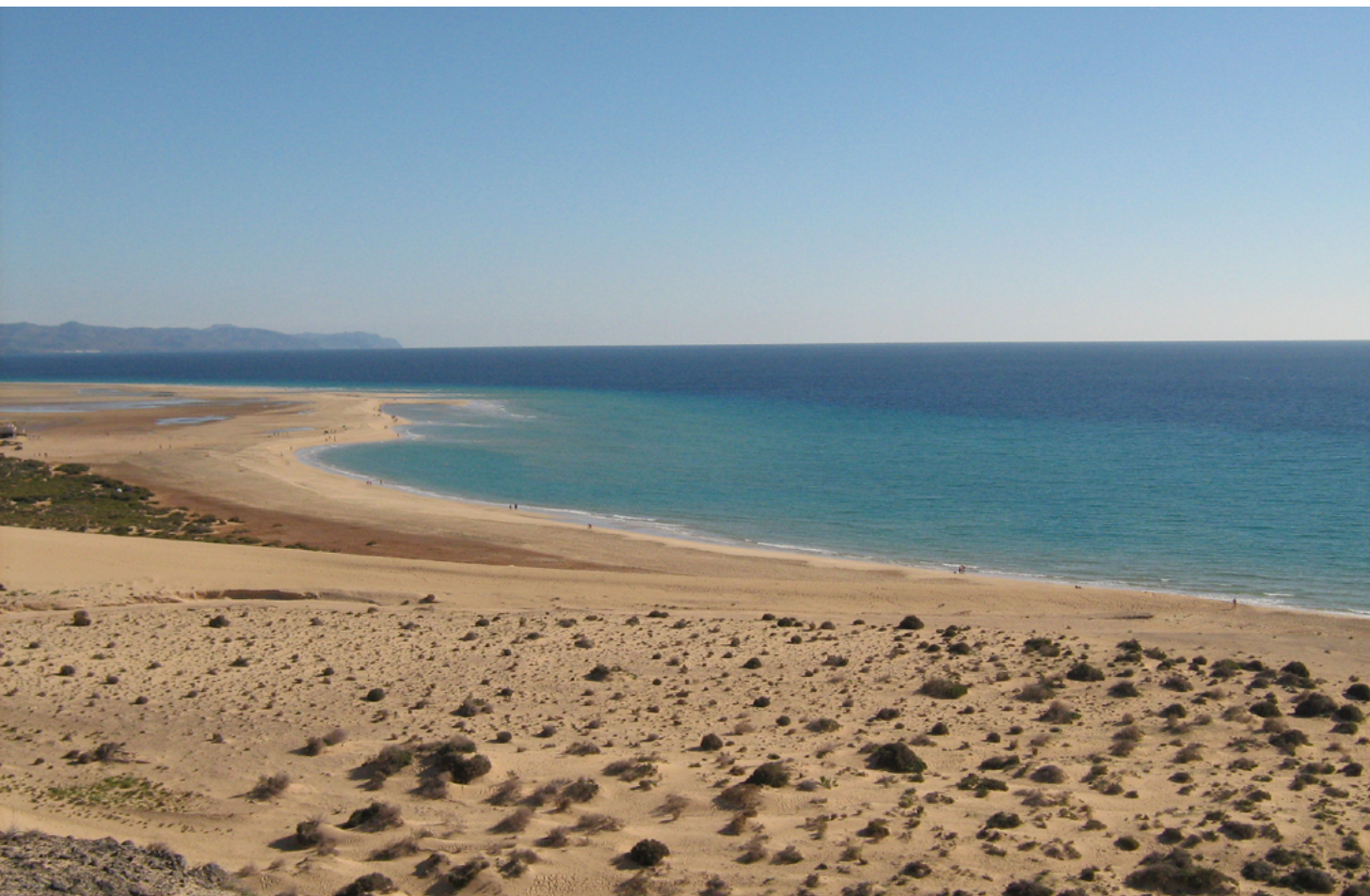
Playa Sotavento, Fuerteventura