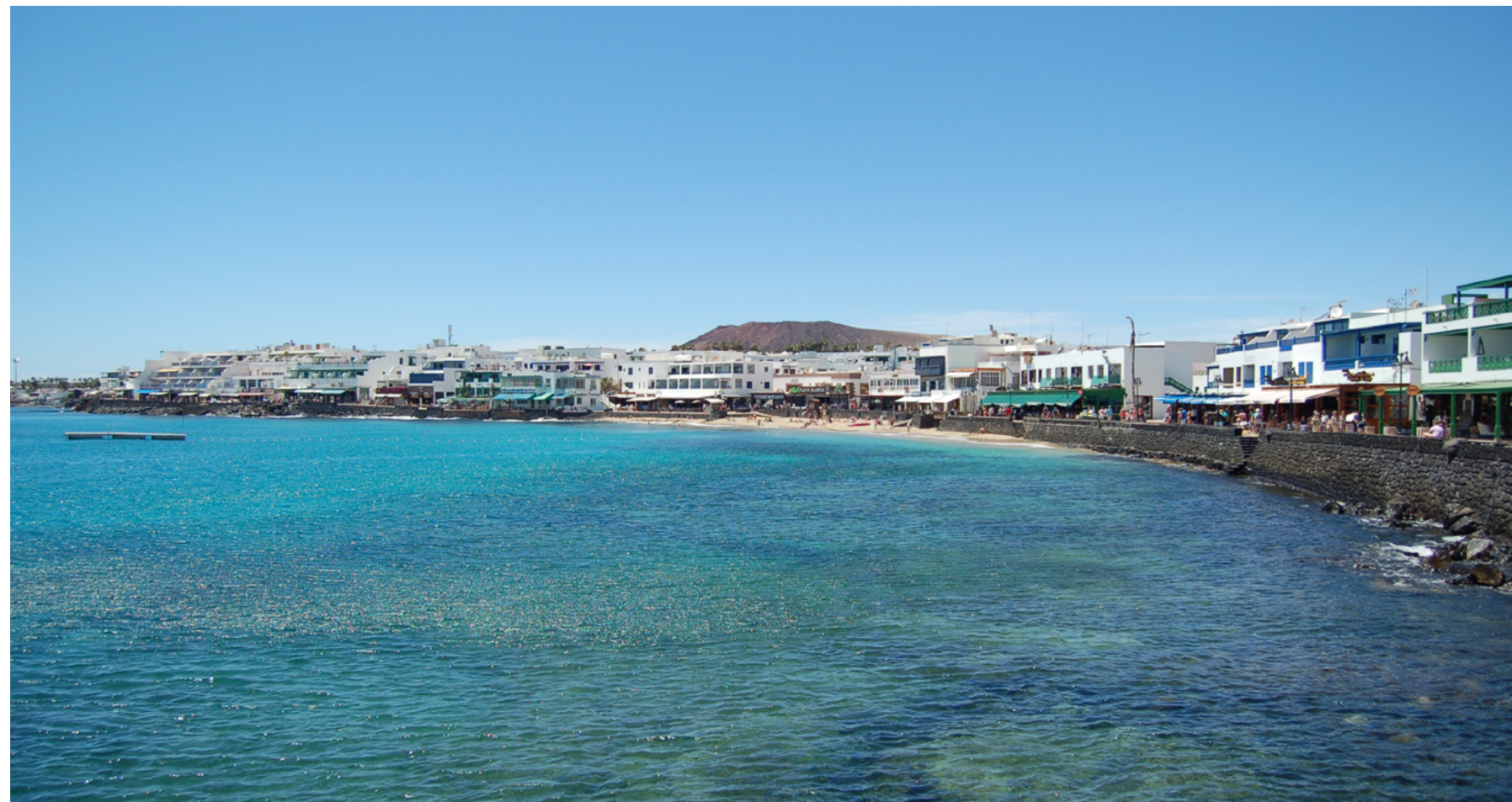
Playa Blanca, Lanzarote