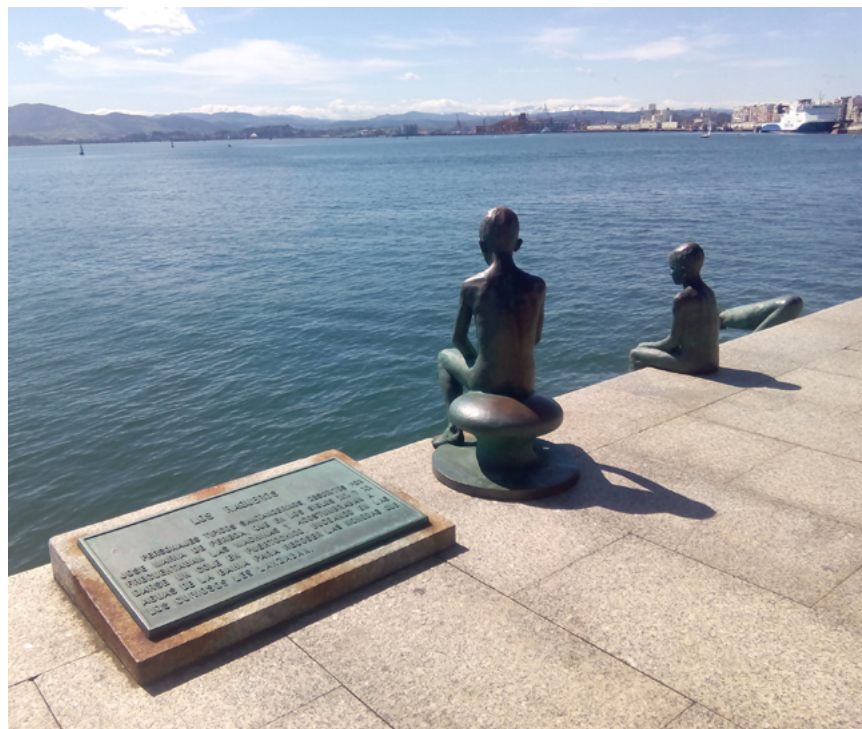
Monumento a los Raqueros, Santander

Sin embargo, El Sardinero no es la única playa que el visitante no debe perderse en Santander, también merece la pena resaltar El Puntal , saliente situado justo enfrente de la bahía de Santander. Su acceso se puede hacer a través de barco desde el embarcadero Santander o a través de la localidad Somo. Sus vistas son privilegiadas con la panorámica del Palacio de la Magdalena y la bahía de Santander de fondo. Esta playa es de arena fina y dorada y cuenta con aproximadamente 4,5 kilómetros de longitud y una anchura de 120 metros, lo que la hace una playa tranquila de ambiente familiar.