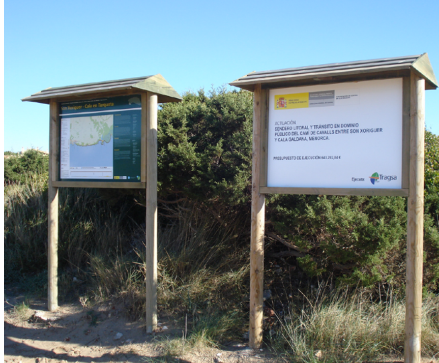
Panel indicativo cerca de Cala en Turqueta

La cala Turqueta es un verdadero paraíso natural. Como se puede adivinar por su nombre, la fina arena de esta playa está bañada por aguas de color azul turquesa. Situada al sur de la isla, se encuentra a mitad del Camino Natural y es una de las calas más bonitas de la isla al ser una playa virgen y estar rodeada por un hermoso pinar. Acto seguido el caminante se topará con la cala Macarelleta que se encuentra a 14 kilómetros de la Ciutadella y es la hermana menor de la cala Macarella . Ambas calas constituyen un enclave increíble y sus aguas son de un azul turquesa tan intenso que promete dejar boquiabierto al visitante.